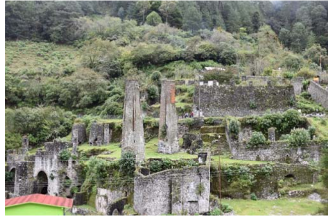
Fig. 3. Ruinas de la ex fundidora de hierro en La Encarnación, PNLM.

En cuanto a la gastronomía, desde hace varios años se elabora en la localidad y de manera artesanal, dulces típicos de manzana y ciruela y se cuenta con la unidad de producción rural piscícola de trucha arcoíris ( Oncorhynchus mykiss ) conocida como “La Trucha Marmolera”, presidida por un grupo de mujeres, quienes brindan el servicio de alimentación a los visitantes en un pequeño restaurant al interior de la unidad de producción. También se elabora “vino de manzana” característico del sitio, sin embargo, se observó que esta tradición se está perdiendo y cada vez son menos las personas que lo producen.