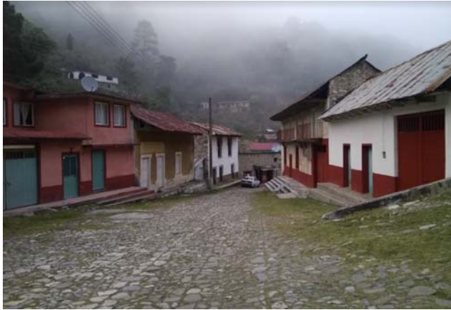
Fig. 2. Calle principal de La Encarnación, PNLM.

estos servicios, en temporada alta de turismo el senderismo. La tirolesa y la renta de bicicletas son las actividades con mayor demanda.